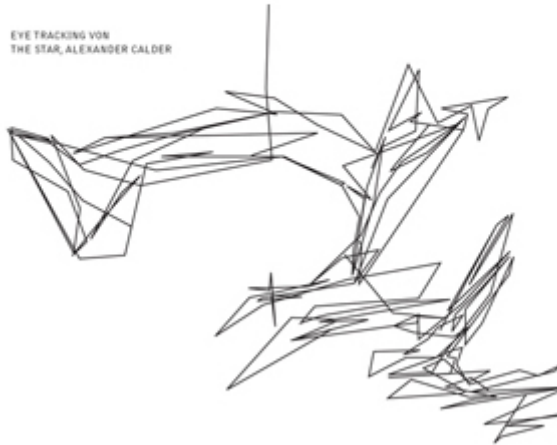
EYE TRACKING VON THE STAR, ALEXANDER CALDER

JEDE SEITE EINE AUGENWEIDE. Du Das Kulturmagazin